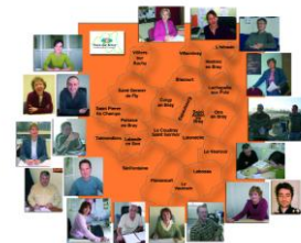
Séminaire, visite, communauté d'acteurs de la maison d'économie solidaire