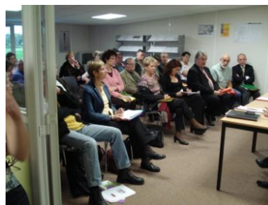
Adaptation service à domicile, concertation de services mutuels sur pays de Bray