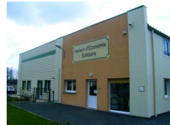
Établissement principal à Lachapelle aux pots (60)

10 ans après les premières actions du projet, il convient aujourd'hui de réévaluer les besoins du territoire afin d'y répondre le plus efficacement possible en tenant compte de la transformation des cultures opérée par notre expérience coopérative. Au travers de cette analyse, il conviendra également de réadapter les outils existants toujours dans un souci d'être au plus proche de ces besoins.