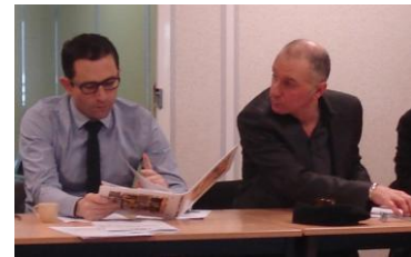
Visite du ministre B Hamon à la maison d'économie solidaire

Cette démarche expérimentale servira de matière à l'analyse plus conceptuelle dans le cadre du développement des pratiques solidaires dans l'économie et de l'innovation sociale.